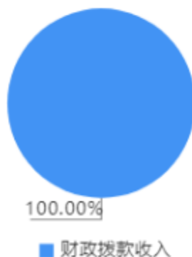
本年收入决算结构图

本年收入合计383.37万元，其中：财政拨款收入383.37万元，占100.00%。