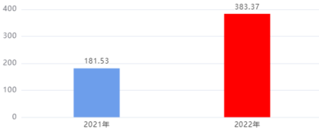
财政拨款收、支决算总计变动情况图 (单位：万元)

2022年度财政拨款收、支总计383.37万元。与2021年度相比，财政拨款收、支总计各增加201.84万元，增长111.19%。主要是2022年新增基础绩效奖收支。