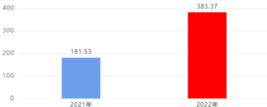
一般公共预算财政拨款支出决算变动情况图（单位：万元）

2022年度一般公共预算财政拨款支出383.37万元，占本年支出合计的100.00%。与2021年度相比，一般公共预算财政拨款支出增加201.84万元，增长111.19%。主要是2022年新增基础绩效奖支出。