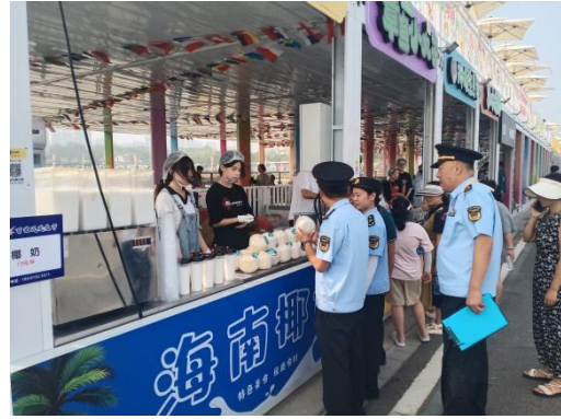
从业人员保持个人卫生

从业人员未保持个人卫生，未穿戴清洁的工作衣、帽等的，由县（市、区）人民政府市场监督管理部门责令限期改正；逾期不改正的，处五十元以上五百元以下罚款；情节严重的，由原备案机关注销信息公示卡。（依据《山东省食品小作坊小餐饮和食品摊点管理条例》第四十五条第一款）