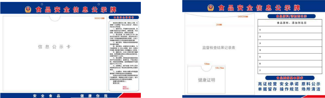
食品安全信息公示牌（式样2）