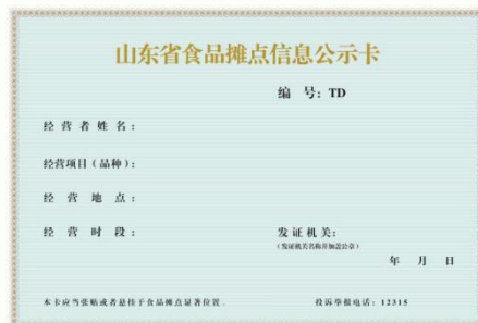
食品摊点信息公示卡