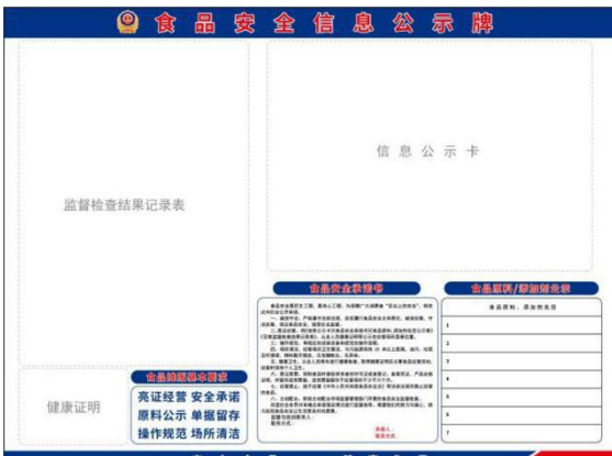
食品安全信息公示牌（式样1）

1. 在经营场所醒目位置公示《食品摊点信息公示卡》《食品安全承诺书》《食品原料、添加剂名目公示表》、从业人员健康证明。