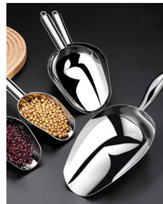
加工、贮存、运输、装卸和销售食品的容器、工具、设备安全、无害并保持清洁