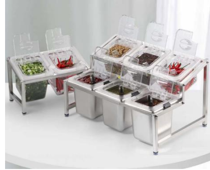
加工生、熟食品的用具、容器分开使用

10. 提供安全、无毒、清洁的餐具、饮具。无专用餐具、饮具清洗消毒设施的，使用符合规定的集中消毒或者一次性餐具、饮具；