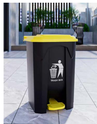
密闭的废弃物容器