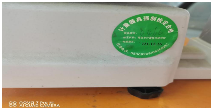
年检电子秤合格证

属于强制检定范围的计量器具，未按照规定申请检定或者检定不合格继续使用的，责令停止使用，可以并处罚款。（依据《中华人民共和国计量法》第二十五条规定）